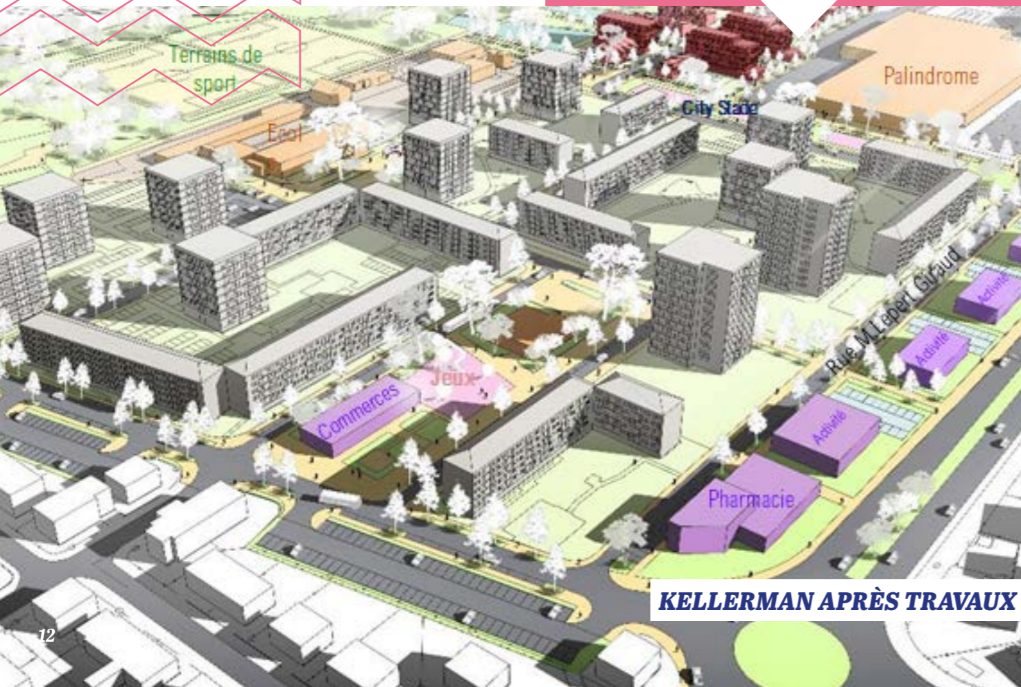
KELLERMAN APRÈS TRAVAUX