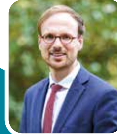
Florian Bercault Maire de Laval Président de Laval Agglomération