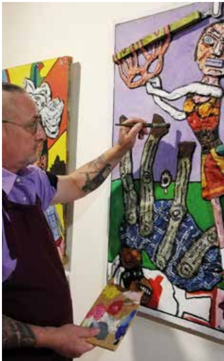
Le Casse du siècle

Café, thé, chocolat... Les objets de l'exposition Riches de Culture nous mettent en appétit ! Ouvrez grand les yeux et les narines pour une découverte sensorielle autour des aliments. De 18 mois à 3 ans / gratuit / sur réservation au 02 53 74 12 30