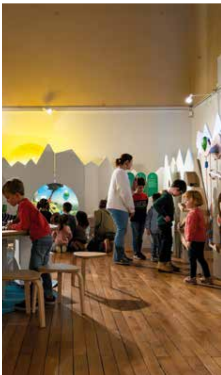
Zoom - Exposition " Fragile ! "

Pour les 2-6 ans / Tarifs : Adulte : 3€ ; enfant à partir de 2 ans : 2€ ; Carte ICOM, demandeur-euse d'emploi : gratuit