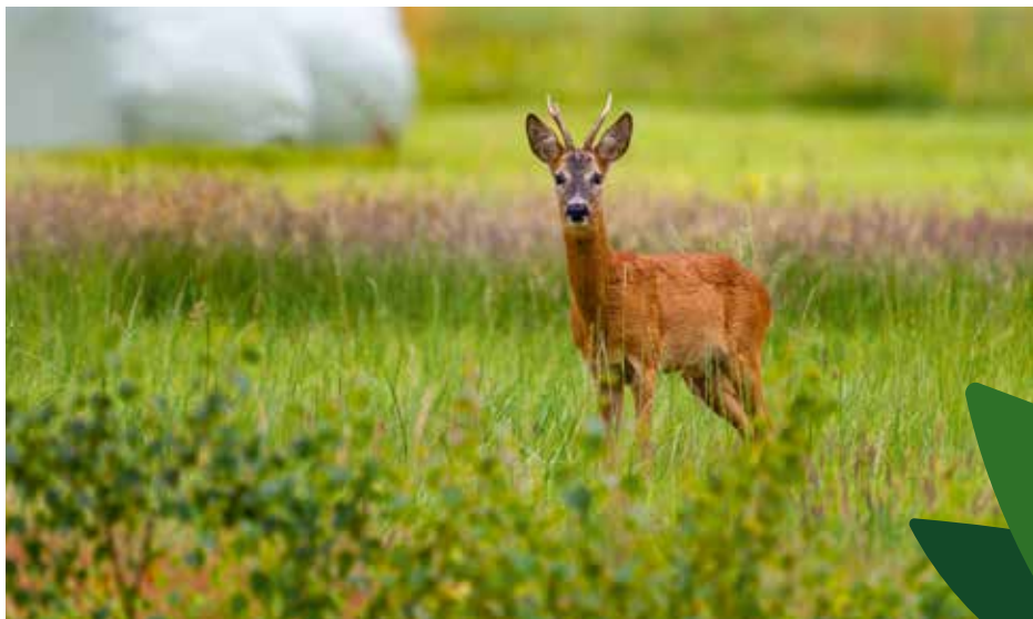
Brocard - Traces et indice