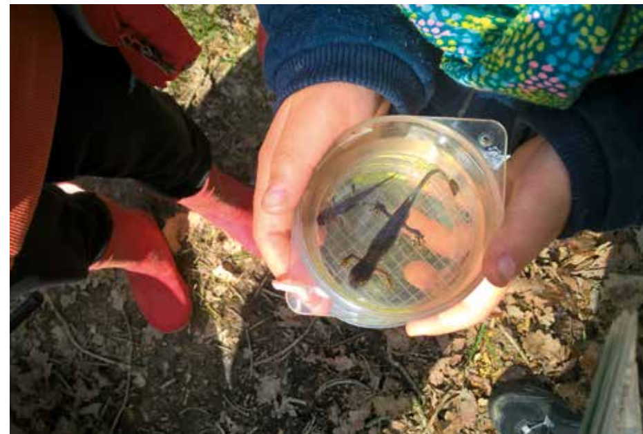
Mare et triton

Venez en famille avec vos petits bouts pour vivre un moment en nature. Réservation obligatoire au CIN Gratuit / Public : enfants entre 18 mois et 5 ans accompagnés d'un adulte.