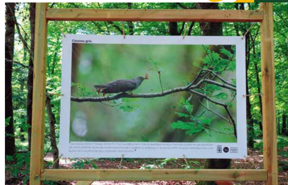
Exposition extérieure - Pris sur le vif