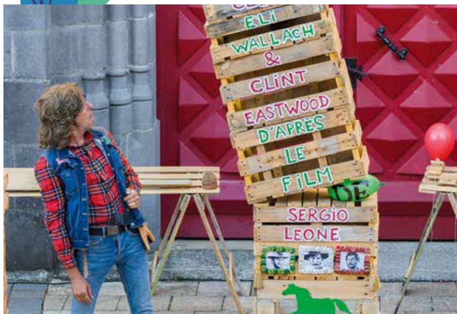
© Le magnifique bon à rien

Tout le programme détaillé sur agglo-laval.fr ou laval.fr Renseignements 02 53 74 12 00