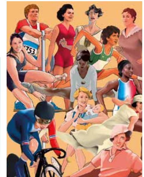
Des femmes en or

Dans le cadre de l'exposition, une projection gratuite du documentaire " Les incorrectes " aura lieu au cinéma L'Avant-scène le mardi 9 juillet à 20h30.