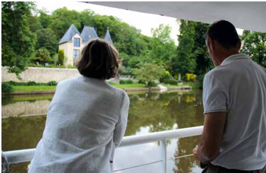
Dîner croisière en musique