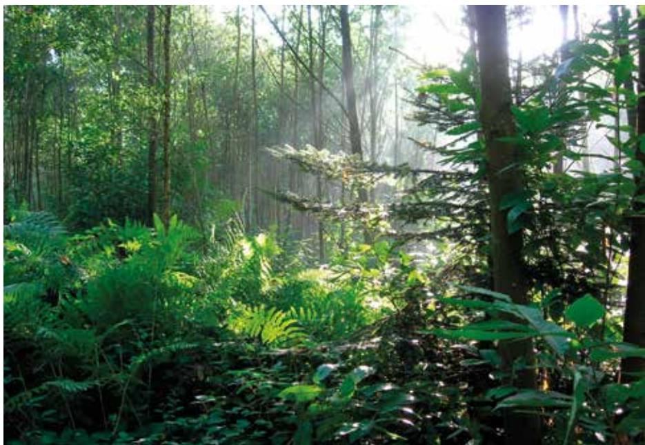
Bois de l'Huisserie