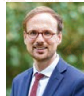
Florian Bercault Maire de Laval Président de Laval Agglomération

Photographie de couverture : Berlin, Fernsehturm / tour de la télévision.